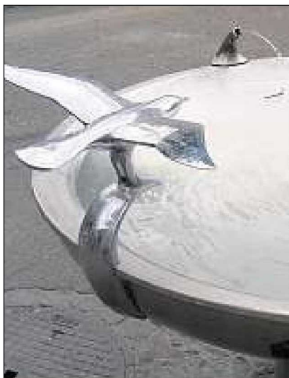
Schlicht: der Möwenbrunnen am Bellevue aus dem Jahr 1938.