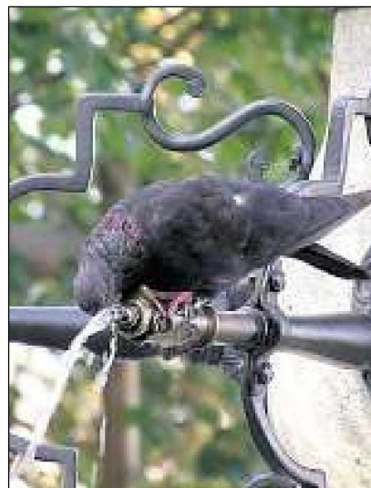
Vogelfreundlich: Wie hier auf dem Lindenhof erfreuen Brunnen auch Tiere.