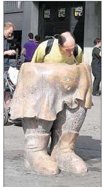
Übergross: Marmor-Brunnenwybli an der Linth-Escher-Gasse.