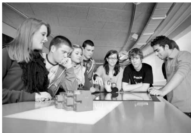
Touch-Table in der ewz-Energieausstellung.

Das ewz nahm ein Public-Private-Partnership-Projekt am Utoquai (Anleuchtung Gebäudefassaden) in Betrieb und realisierte das erste Plan-Lumière-Projekt beim Bau der Tramlinie 4 in Zürich-West, das sogenannte Leuchtenlager mit grünen LED-Bodeneinbauleuchten.