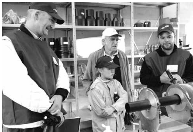
Schweissen von Kunststoff-Wasserleitungen: Demonstration an der Stolleneinweihung im Seewasserwerk Moos.

Im Rahmen der flankierenden Massnahmen zur Westumfahrung werden in der Albisstrasse auf dem über einen Kilometer langen Abschnitt zwischen der Stadtgrenze und dem Owenweg die rund 100 Jahre alten Hauptleitungen und das Verteilnetz ersetzt und erneuert. Die hydraulische Dimensionierung führte zu einer Reduktion der benötigten Durchmesser, so dass neu eine Stahlleitung (DN 700 mm/DN 600 mm) mittels