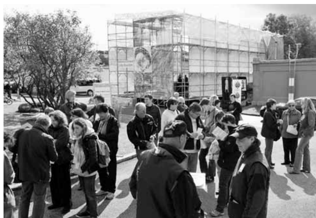
Stolleneinweihung: Werkführung im Seewasserwerk Moos.

Mit einem «Wochenende der offenen Türen» erhielt die Bevölkerung die Möglichkeit, den Stollen bzw. dessen Anfang und Ende in 130 m Tiefe unter dem Reservoir Lyren und dem Seewasserwerk Moos zu besichtigen. In diesem Rahmen informierte die Wasserversorgung auch über Themen wie Wassertarif, Mikroverunreinigungen im Trinkwasser oder Qualitätssicherung. Nahezu 20 000 Besucherinnen und Besucher nutzten die Gelegenheit.