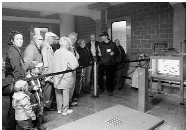
Wasserprüfer: Die Fischtestanlage bei der Stolleneinweihung im Seewasserwerk Moos war ein Publikumsmagnet.

den «Mülheim Water Award» für herausragende angewandte Forschung. In Zusammenarbeit mit Fachleuten der Eawag und der Zürcher Hochschule für angewandte Wissenschaften (ZHAW) in Wädenswil wurde das prämierte System weiterentwickelt und ein Prototyp für die kontinuierliche Überwachung von Bakterienzellen gebaut. Das Analysegerät liefert für die Qualitätsüberwachung in der Wasserversorgung Zürich sehr hilfreiche Daten. Dieses System wird es erlauben, die 2010 begonnenen Untersuchungen zur mikrobiologischen Stabilität des Trinkwassers nach der Aufbereitung mit Filtrationssystemen zu vertiefen. Solche Untersuchungen sind wichtig zur Abklärung der Effizienz von Sandfiltern.