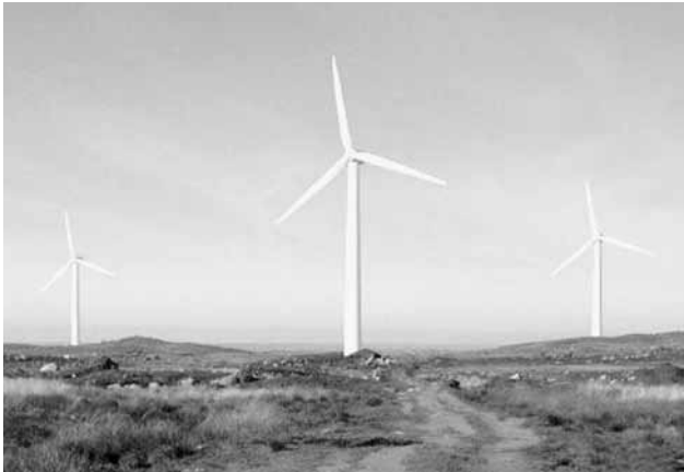
Windpark Hög Jaeren.

dem Weg zur Projektbewilligung und traf die Vorauswahl der potenziellen Turbinenlieferanten.