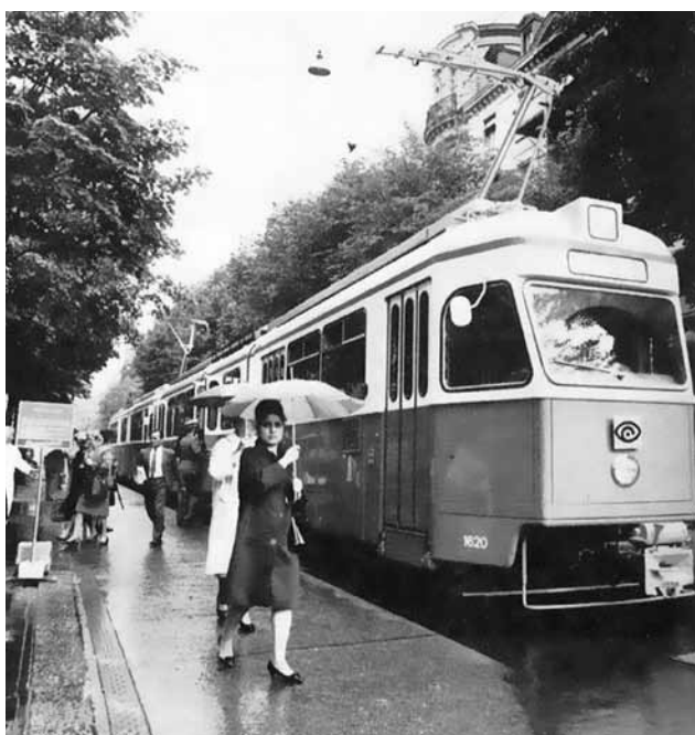
Mirage-Trams waren über 40 Jahre zuverlässig unterwegs.

Im Oktober wurde die Ausschreibung für zwölf neue Doppelgelenktrolleybusse und 21 neue Gelenktrolleybusse publiziert, welche die noch im Einsatz stehenden Hochflurbusse ersetzen werden.