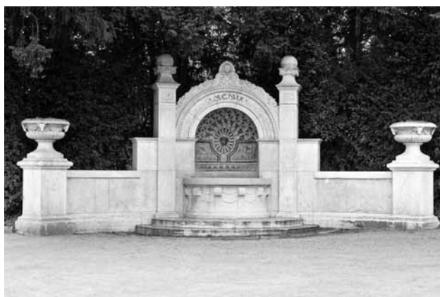
Mosaikbrunnen beim General-Guisan-Quai.

Der Bau und der Betrieb der öffentlichen Brunnen ergänzen die Aufgaben der Wasserversorgung Zürich. Darüber