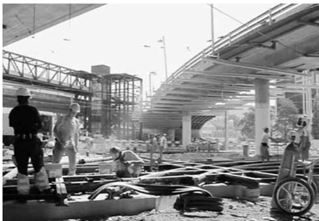
Grossbaustelle am Escher-Wyss-Platz.