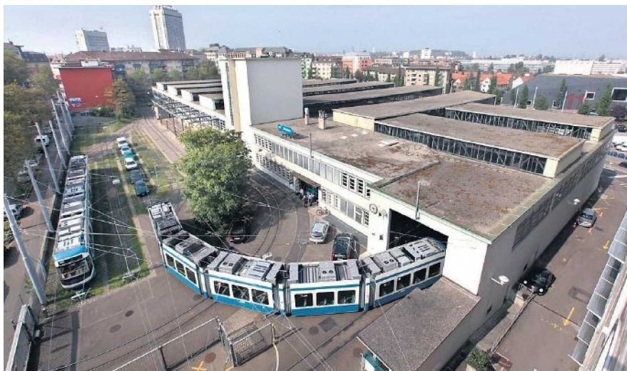
Das Depot Oerlikon wird zurzeit für weitere 14 Cobras ausgebaut.

Die VBZ brauchen wegen neuer Tramlinien und längerer Fahrzeuge mehr Platz.