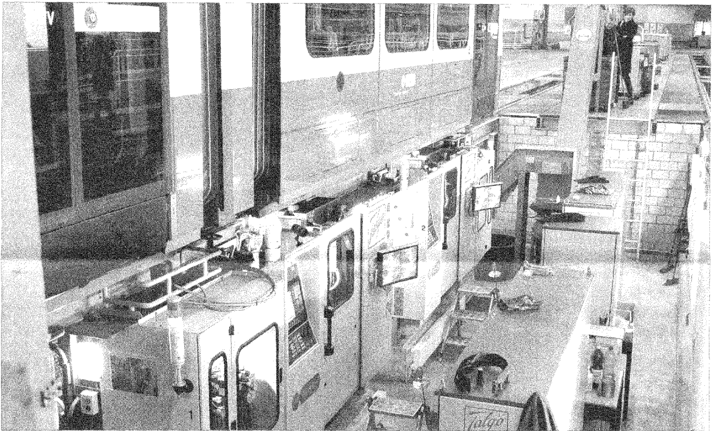
Das neue Tramdepot beherbergt modernste technische Anlagen für die Wartung der Trams. Zum Beispiel für das Schleifen der Räder.