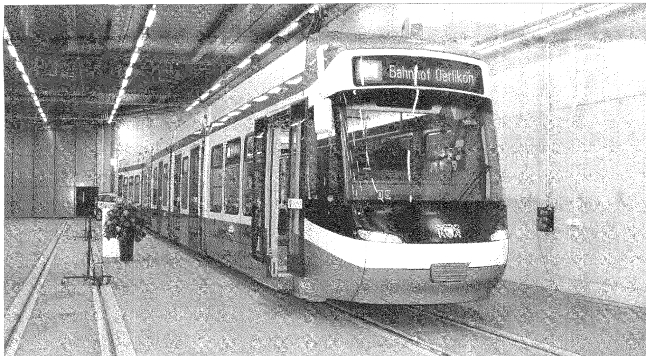
Im Neubau können sieben Cobra-Trams und eines vom Typ 2000 untergebracht werden.